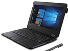
ラップトップモード

ディスプレイ部分を回転させることで、4つのモードに切り替えが可能です。 たとえば文書作成はラップトップ、資料閲覧はスタンド、Webでの検索や屋 外での調査はタブレット、プレゼンテーションはテントと、用途に合わせて 自由なスタイルで利用できます。