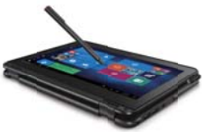
タブレットモード