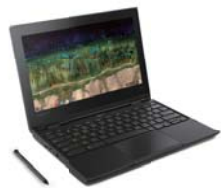
ラップトップモード

文書作成はラップトップ、資料の閲覧はスタンドモード、Webでの検索や屋外での調査はタブレット、プレゼンテーションはテントなど、用途に合わせてモードを自由に切り替えることができます。一台でさまざまな授業に対応できて便利です。