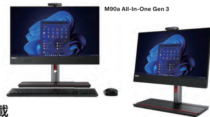
M70a All-In-One Gen 3