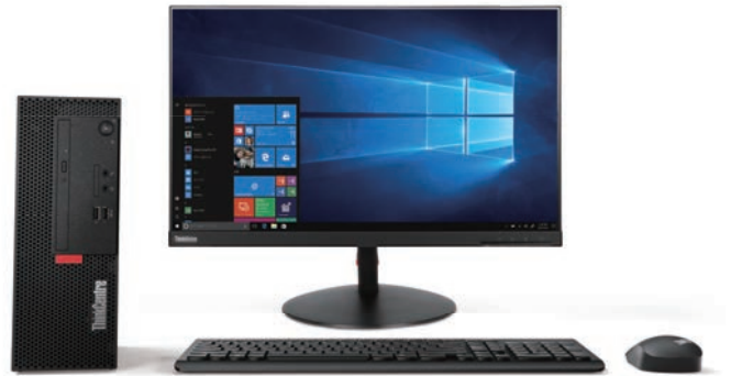
*モニター別売 *ワイヤレスキーボード・マウスは該当モデルのみ搭載

7.4Lのフォームファクターを採用し、よりコンパクトに進化したオフィスワーク向けエントリーデスクトップPC、ThinkCentre M710e Small。ポート類をフロント部に配するなど、性能と利便性を追求しています。コストパフォーマンスにも優れ、ビジネス利用に適した一台です。