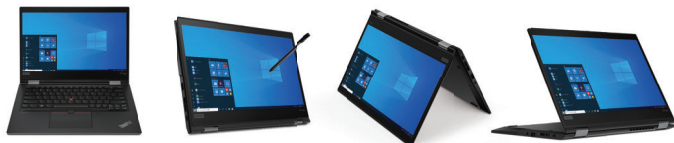
ラップトップモード

薄型・軽量の13.3型コンパクト・モバイルノートPC。作業、プレゼンテーション、コミュニケーション、閲覧のそれぞれに適した4つのモードを柔軟に使い分けることができます。