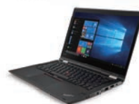
ラップトップモード