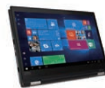
タブレットモード