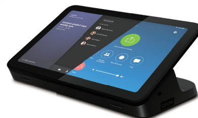
Lenovo IP Controller (PoE接続)