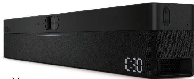
ThinkSmart One 本体