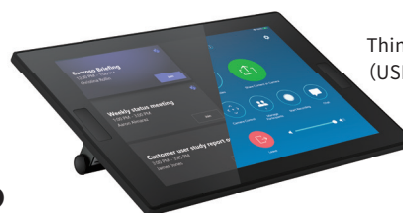
ThinkSmart Controller (USB接続)

会議に必要なすべてを一体化した設計 ケーブル露出を最小化し、会議室内の美観を保つ 小～中規模会議室向けオールインワンモデル