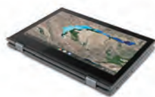
タブレットモード