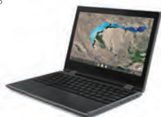
ラップトップモード

文書作成はラップトップ、資料の閲覧はスタンドモード、Webでの検索や屋外での調査はタブレット、プレゼンテーションはテントなど、用途に合わせてモードを自由に切り替えることができます。一台でさまざまな授業に対応できて便利です。