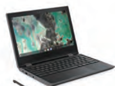
ラップトップモード

文書作成はラップトップ、資料の閲覧はスタンドモード、Webでの検索や屋外での調査はタブレット、プレゼンテーションはテントなど、用途に合わせてモードを自由に切り替えることができます。一台でさまざまな授業に対応できて便利です。