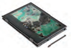
タブレットモード