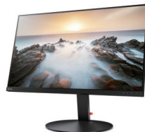
ThinkVision P32u-10 (61C1RAR2JP)