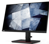
ThinkVision P24h-20 (61F4GAR1JP)