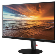
ThinkVision P27u-10 (61CBGAR1JP)