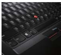
リフトンロック機構

スタンド、タブレット、テントモードにするとキーボード が無効化され、さらにフレームが上昇しキーをロック するLift'n' Lock(リフトンロック)キーボード機構により、 誤ってキーが押される事を防ぐと共にキートップや トラックポイントの外れを防止、持ちやすさも向上 します。